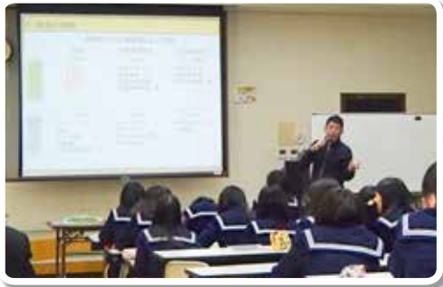
H29.12.13 県立和歌山商業高等学校 (講師：税理士)