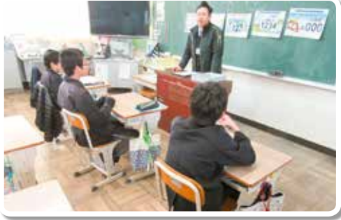
H30.1.30 由良町立衣奈小学校 (講師：地方庁職員)