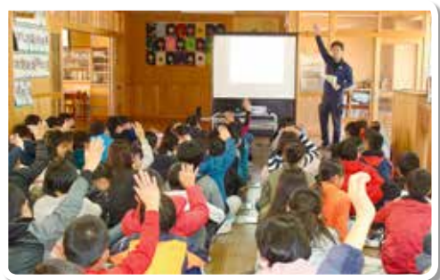
H29.12.5 新宮市立神倉小学校 (講師：協会会員)