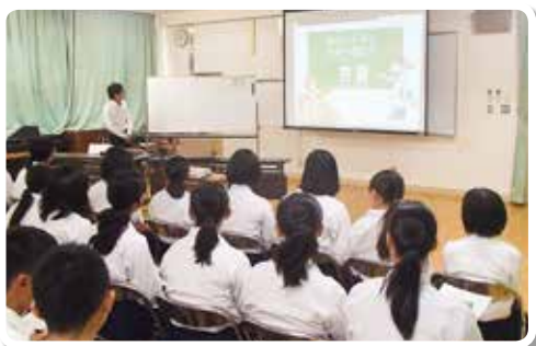
H29.6.30 串本町立串本中学校 (講師：税務職員)