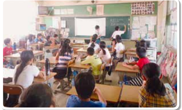
和歌山市立日進中学生による租税教室 (和歌山市立太田小学校)