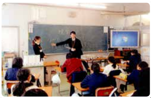
H30.1.16 日高川町立中津小学校 (講師：地方庁職員)