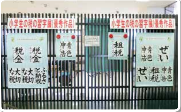
小学生税の習字展 (海南市 海南駅前かいぶつくん)