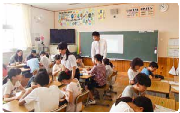
和歌山市立藤戸台小学校

和歌山大学教育学部において、大学・学生・税の専門家(税務職員・税理士)が協働して、「租税教育」をテーマとして社会科教育研究に取り組み、和歌山市内の小学校で学生が自作の授業を行いました。