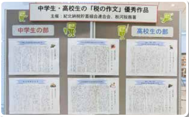
中学生・高校生の税の作文 (紀の川市 紀の川市役所)