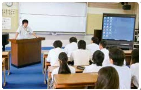
H29.7.7 県立海南高等学校美里分校 (講師：税務職員)

租税教室は、次代を担う児童・生徒が、「税」について関心を高め、税の意義や役割について理解を深めていくことを目的としています。