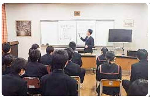
H29.12.14 田辺市立新庄中学校 (講師：税務職員)