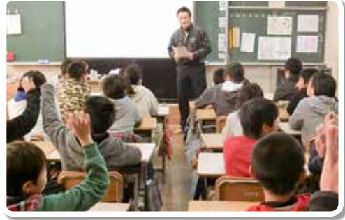
H30.2.7 海南市立内海小学校 (講師：協会会員)