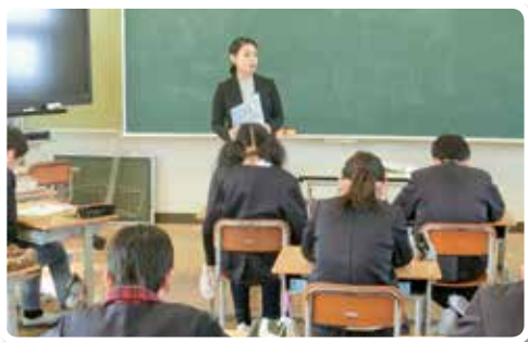
H30.1.23 有田市立田鶴小学校 (講師：税務職員)