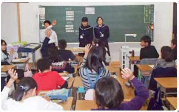
和歌山市立伏虎義務教育学校後期課程生徒による租税教室 (同前期課程)