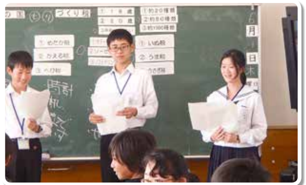
和歌山市立貴志中学生による租税教室 (和歌山市立貴志小学校)