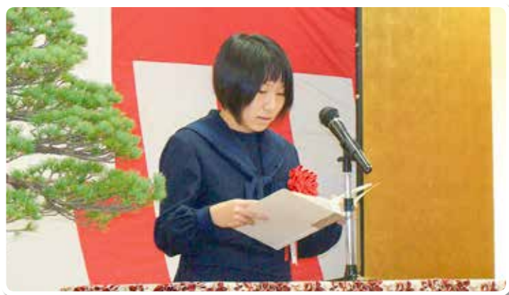
中学生作文朗読 (国税庁長官賞)