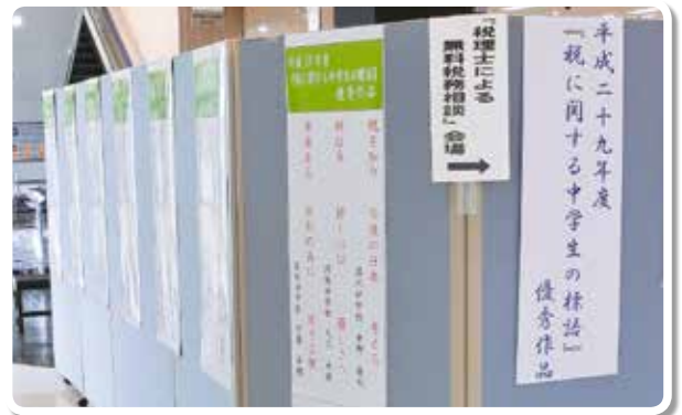
中学生の税の標語 (御坊市 オークワロマンシティ)