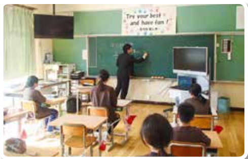
H30.1.19 白浜町立白浜第二小学校 (講師：税務職員)