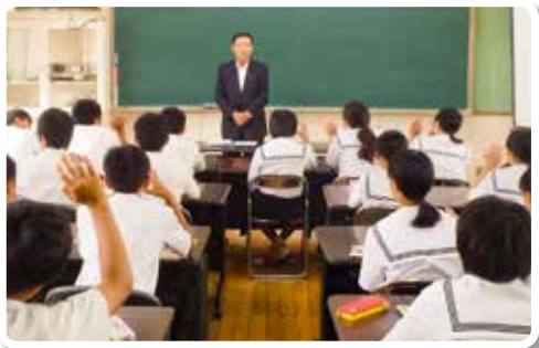
H29.7.12 海南市立第三中学校 (講師：税理士)