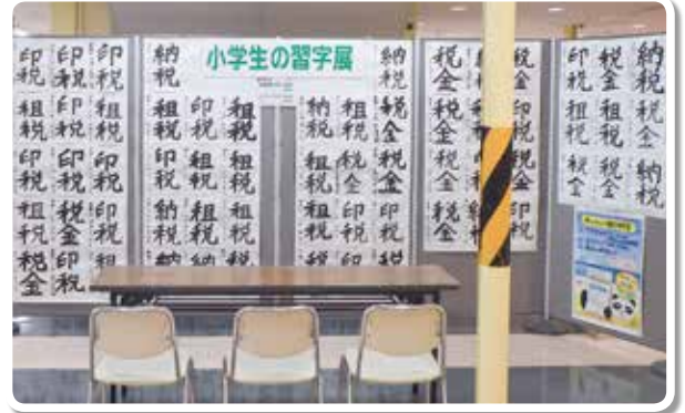
小学生の習字展 (田辺市 オークワパビリオンシティ)