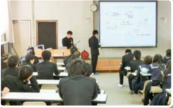
県立和歌山商業高等学校学生による租税教室 (県立和歌山商業高等学校)