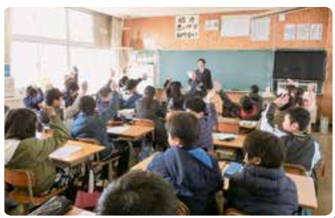
H30.2.9 橋本市立柱本小学校 (講師：税務職員)