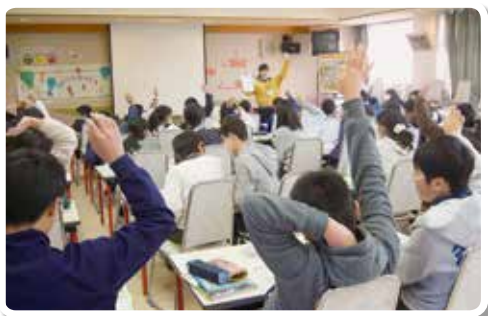
H30.1.26 和歌山市立砂山小学校 (講師：協会会員)