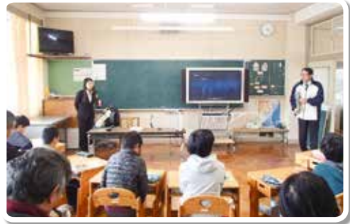
H29.12.12 古座川町立三尾川小学校・ 明神小学校 (合同) (講師：協会職員)