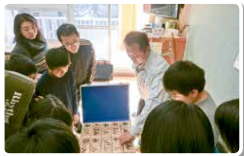
H29.12.20 有田川町立八幡小学校 (講師：協会会員)