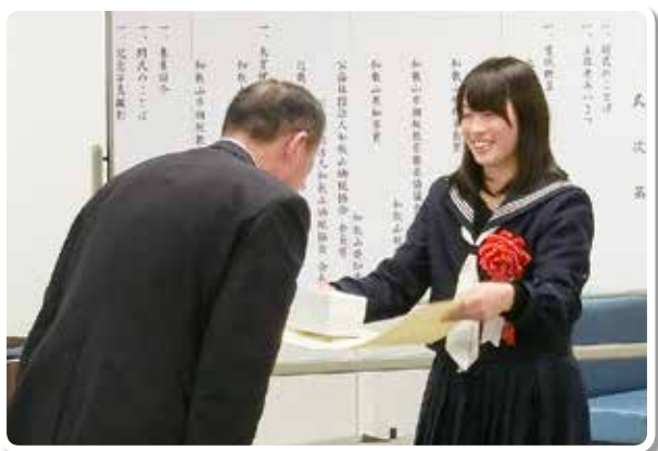
高校生作文表彰 (大阪国税局長賞)