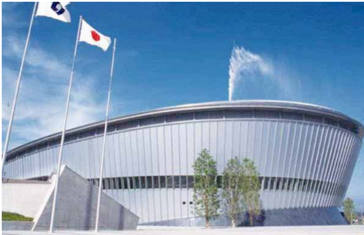
和歌山ビッグホール

当協議会におきましても、この内容を取り入れ事業活動を展開するとともに、選挙権年齢の引き下げに伴い、高等学校や大学等での社会参画に係る実践力を育成するため、関係民間団体の方々にも参画していただき、一層の租税教育の充実を図っていきたいと考えております。皆様方におかれましても、租税教育の更なる充実のため、ますますの御支援、御協力を賜りますようお願い申し上げます。