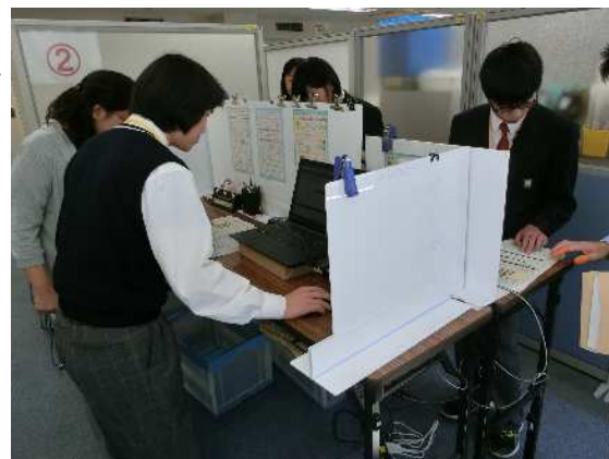
(写真は就業体験学習に参加した笠田高等学校の皆さん)

7 名の高校生が考えたクイズは、実際にクイズを解いた小学生から「面白くて、税金に興味を持てるようになった」と好評でした。