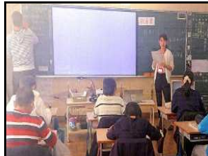
平成 30 年 12 月 5 日 和佐小学校 講師：日高川町役場職員