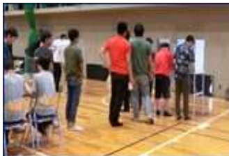
平成 30 年 7 月 4 日 和歌山工業高等専門学校 コラボ授業