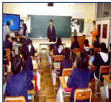
【御坊納税協会役員による租税教室（左から稲原小学校・衣奈小学校・志賀小学校）】